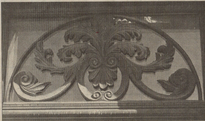
Snímky nahoře a dole - řezbářské detaily na vstupních portálech obchodů a domů na tachovském náměstí.