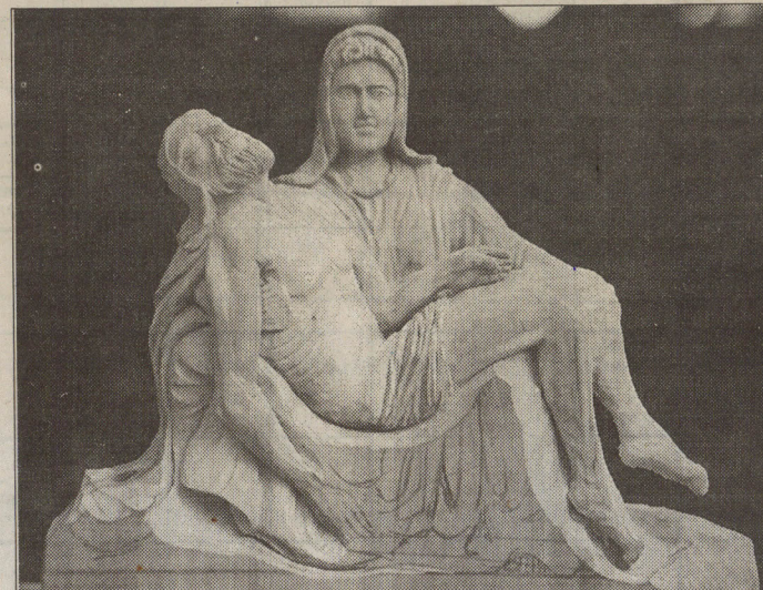
Námět zase trochu z jiného soudku - sousouší vytvořené podle Michelangelovy Piety. Na díle se ještě pracuje.