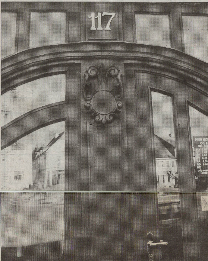
Tyto dveře s výlohou mají k „sámoškovým“ hliníkovým profilům z dob socialismu opravdu daleko.